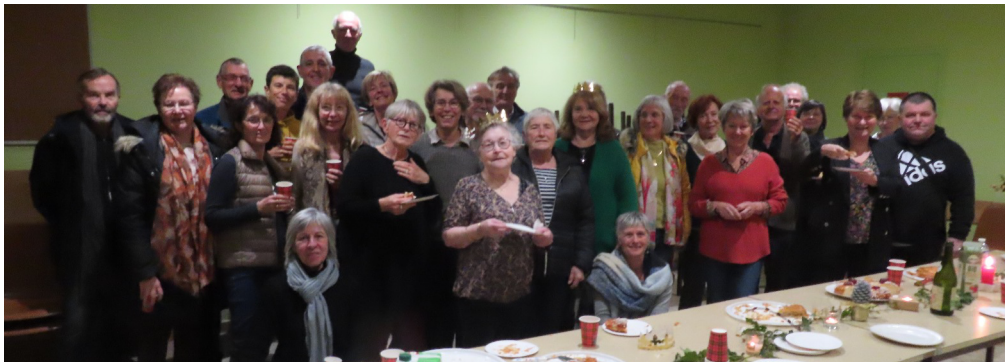
Vœux de l'Association avec la La Galette des rois